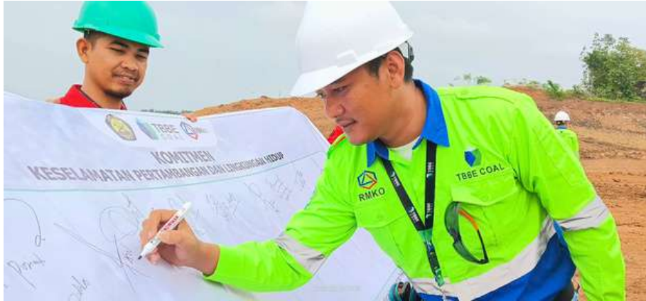
Penutupan kegiatan BK3N 2023 ditandai dengan penandatanganan Komitmen Keselamatan Pertambangan dan Lingkungan Hidup.