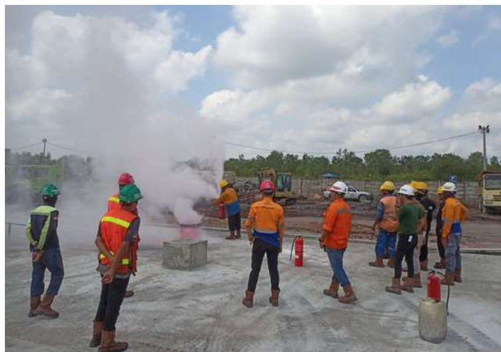
Kegiatan pelatihan APAR diselenggarakan untuk meningkatkan kemampuan karyawan di site Pelabuhan Musi 2 dalam menanggulangi kebakaran.