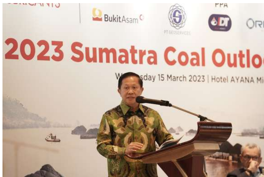
President Direktur PT RMK Energy Tbk (RMKE) berbicara di forum 2023 Sumatra Coal Outlook Conference yang diselenggarakan oleh Petromindo pada 15 Maret 2023.