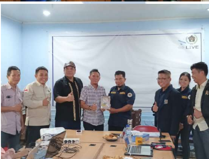
Persatuan Wartawan Indonesia (PWI) Sumatra Selatan menggelar pelatihan bagi wartawan di Sumatra Selatan di Pusat Program Pendidikan Jurnalistik, Palembang.