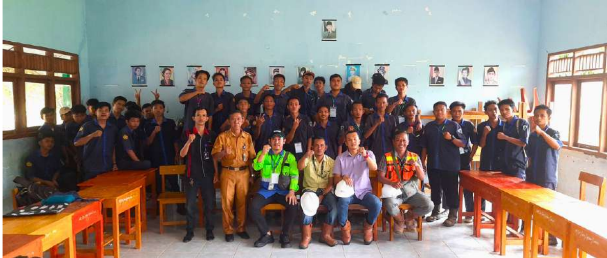
Perwakilan PT TBBE dan PT RMKO menjadi tim penguji kompetensi di SMK Negeri 1 Belimbing, Kabupaten Muara Enim

P T Truba Bara Banyu Enim (TBBE) dan PT Royaltama Mulia Kontraktorindo (RMKO) pada Maret lalu diundang untuk menjadi tim penguji kompetensi keahlian Teknik Kendaraan Ringan Otomotif (TKRO) di SMK Negeri 1 Belimbing, Kabupaten Muara Enim.